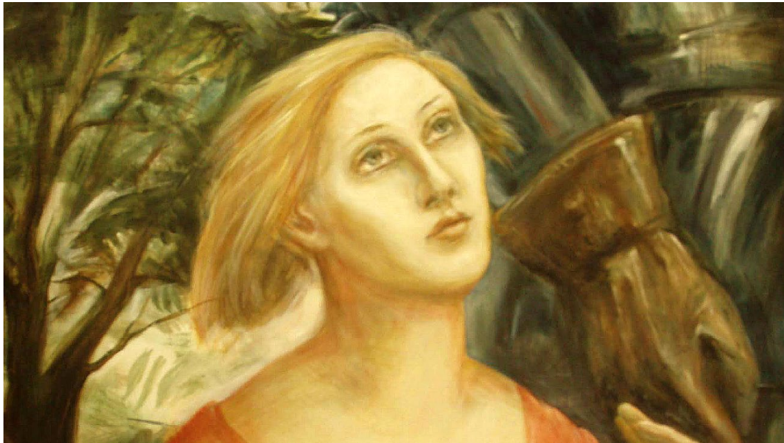
Bild: Anette Peucker-Krisper: Das Käthchen von Heilbronn – ©Kleist-Museum