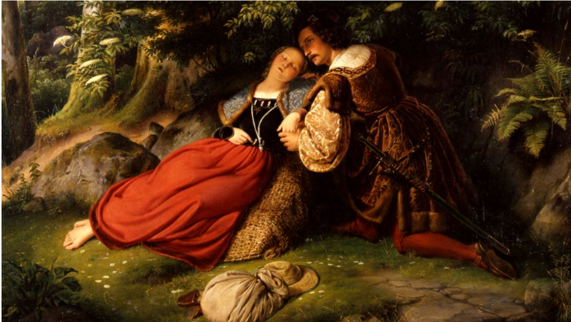
Bild: Wilhelm Nerenz: Das Käthchen von Heilbronn, 1836